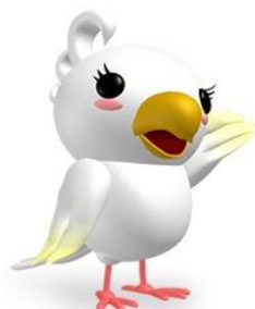
附属図書館 マスコットキャラクター おかめちゃん