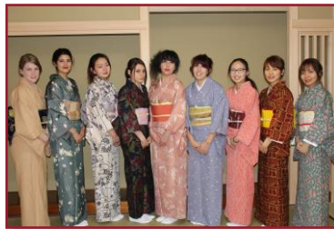
日本文化体験きもの教室の様子

研修終了時に修了レポートを提出します。そのために指導教員による個別指導も行われます。 ※成績証明書が発行可能です。 ※早期修了は、原則としてできません。