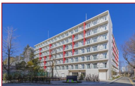
「安心・安全・快適」な音羽館の外観

※食事については、学内の食堂を利用する学生や、他の寮生と一緒に自炊を楽しむ学生もいます。